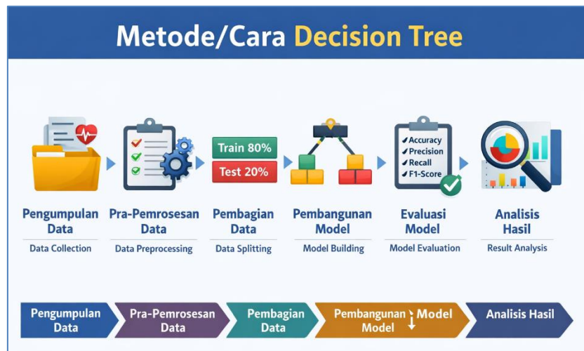
Gambar 1. Alur dan Desain Penelitian

menghadapi ketidakseimbangan data [16]. Alur penelitian ini dirancang secara sistematis agar setiap tahapan saling terintegrasi dan menghasilkan model klasifikasi yang optimal serta dapat diandalkan.