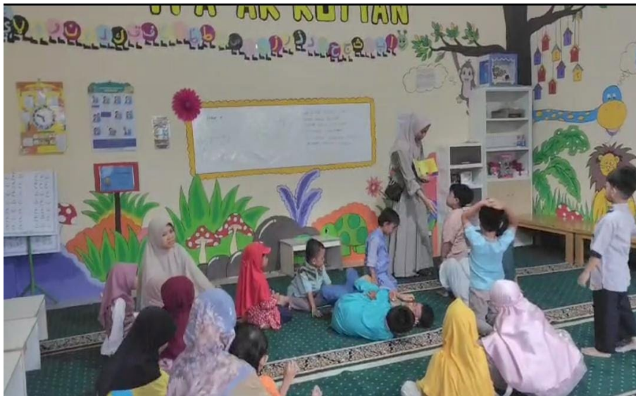
Gambar 3. Observasi Suasana Pembelajaran

menjadi salah satu faktor yang menyebabkan penggunaan media pembelajaran interaktif belum diterapkan secara optimal. Gambar 3 menggambarkan suasana kegiatan pembelajaran di lokasi mitra.