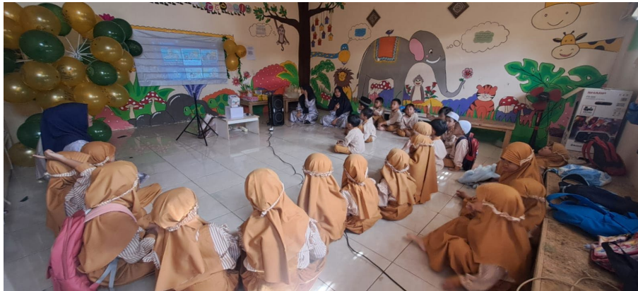
Gambar 5. Pemanfaatan Youtube dalam Pembelajaran

menggunakan media digital dalam kegiatan belajar mengajar. Penggunaan YouTube sebagai media pembelajaran juga memberikan dampak positif terhadap motivasi belajar peserta didik. Anak-anak terlihat lebih aktif dalam mengikuti pembelajaran dan menunjukkan ketertarikan yang lebih tinggi terhadap materi yang disampaikan. Gambar 5 menggambarkan kegiatan pendampingan yang dilakukan tim dengan mitra, dimana guru dapat mengoperasikan secara mandiri dari hasil kegiatan pelatihan dan bantuan sarana prasarana yang diberikan.