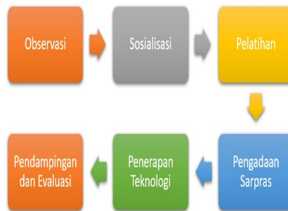
Gambar 2. Tahapan Pelaksanaan Kegiatan

Metode pelaksanaan kegiatan dilakukan secara partisipatif dengan melibatkan mitra pada setiap tahapan kegiatan. Adapun tahapan pelaksanaan kegiatan pengabdian kepada masyarakat terdiri dari observasi, sosialisasi, pelatihan, pengadaan sarana prasarana, pendampingan dan evaluasi (Khasanah, Murdowo, & Arifin, 2024). Gambaran alur pelaksanaan pengabdian kepada masyarakat disajikan pada Gambar 2.